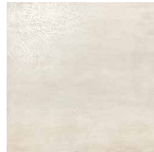
Miele 60x60 RI6003RP