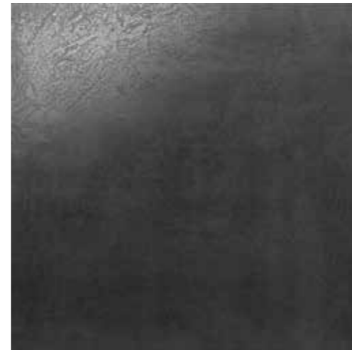
Antracite 60x60 RI6002RP

GRES PORCELLANATO LAPPATO RETTIFICATO FULL BODY - SPESSORE 10,5 mm -