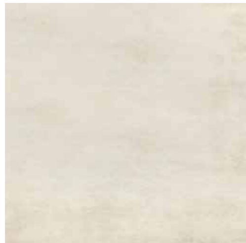
Miele 60,8x60,8 RI6003RE

GRES PORCELLANATO LAPPATO RETTIFICATO FULL BODY - SPESSORE 10,5 mm -