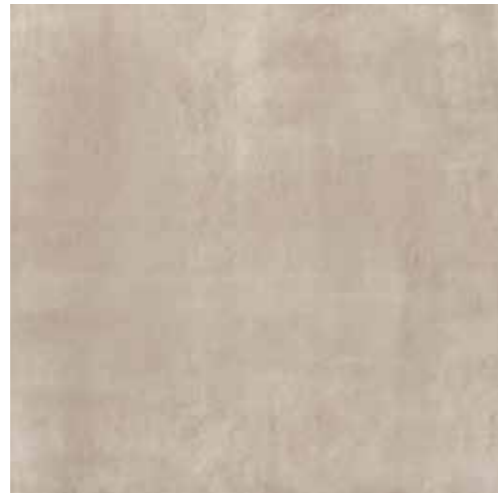
Canapa 60,8x60,8 RI6004RE