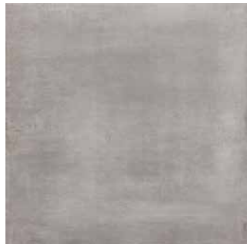
Grigio 60,8x60,8 RI6001RE