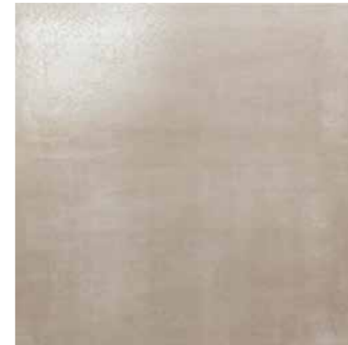
Canapa 60x60 RI6004RP