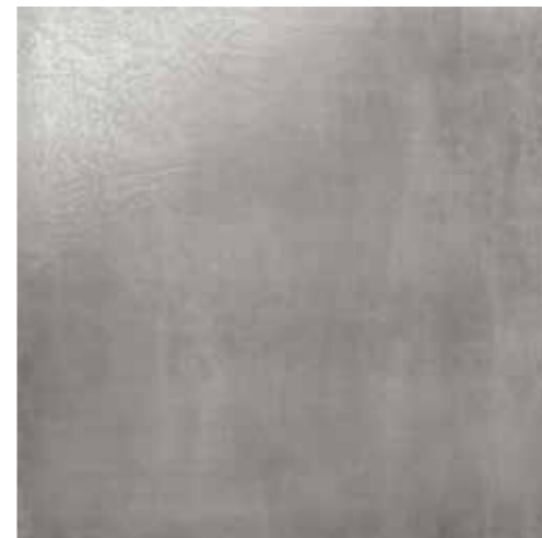
Grigio 60x60 RI6001RP